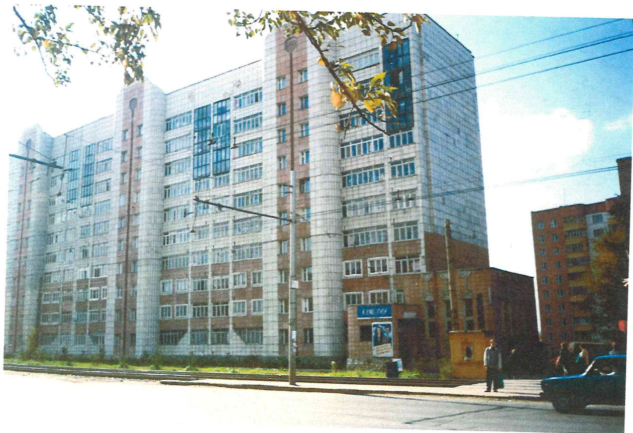
Жилой дом, Бульвар Гагарина, 66, с магазином «Цветы».