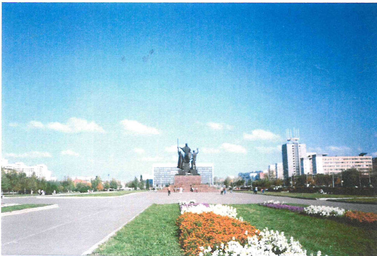
Монумент «Героям фронта и тыла».

После ввода в эксплуатацию нового здания Пермского драматического театра (ныне «Театр-Театр») была принята программа сноса частных домов между улицами Ленина – Коммунистической (ныне Петропавловской) и Борчанинова - Поповой для создания городской эспланады на месте бывших огородов и усадебных построек позапрошлого века.