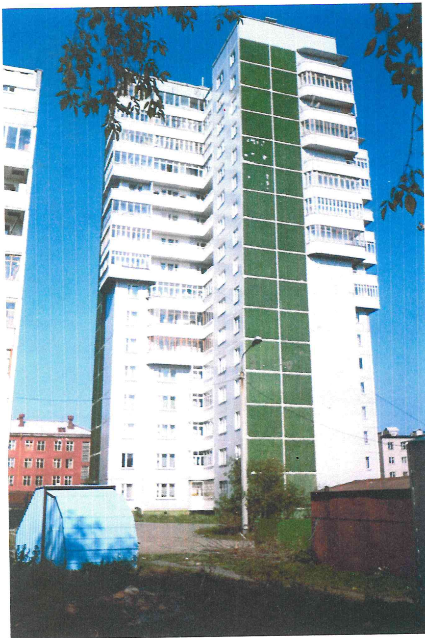
Жилой 16-этажный дом по ул. Пушкина, 9а.

Ж илой дом по ул. Пушкина, 9а, был одним из первых высотных домов по проектам и технологии монтажа крупнопанельного домостроения.