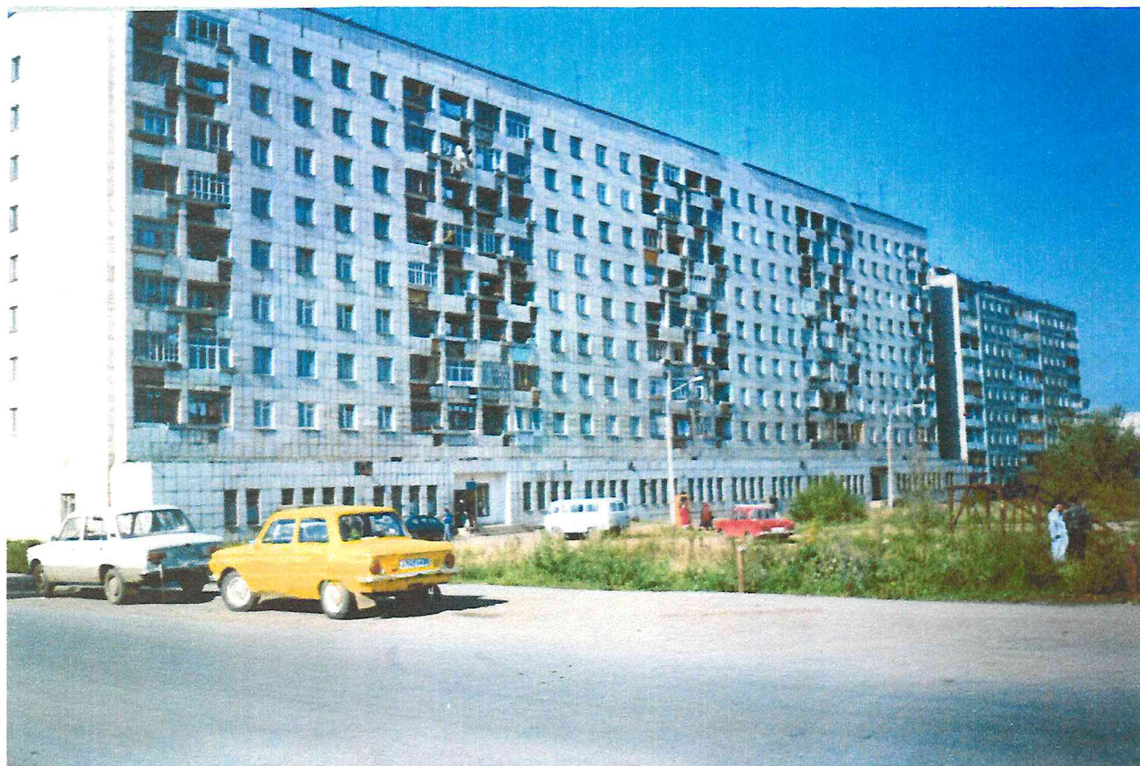
Жилой дом, Алапаевская, 15, со встроенной поликлиникой в микрорайоне Крохалева.

М икрорайон Крохалева, в основном, застраивался ОКСом промышленных заводов Свердловского района, которые финансировались только по титулу жилищное строительство. Поэтому строить отдельно стоящие медицинские предприятия ОКСы заводов не могли.