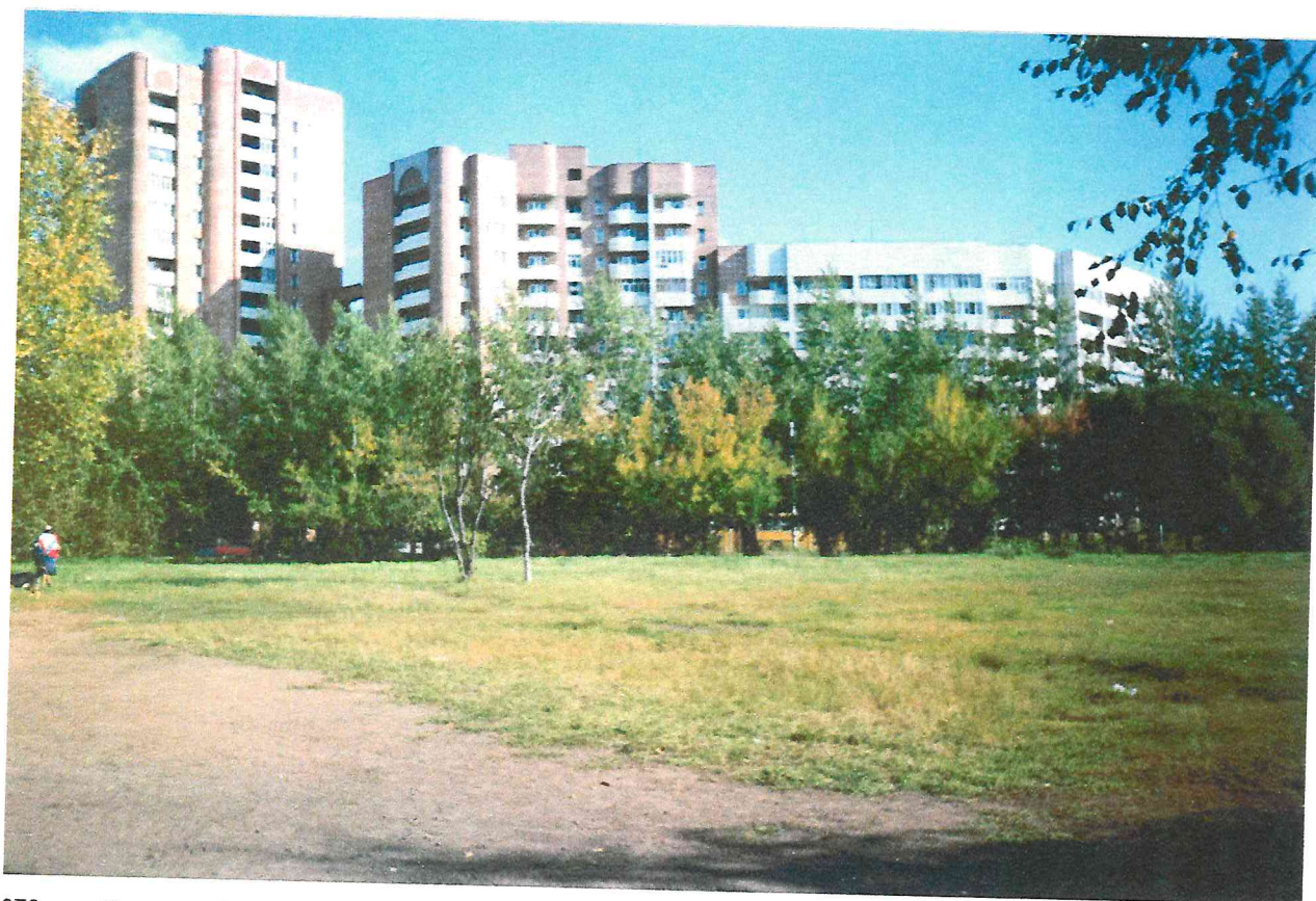
Жилой дом Крупская, 42, с магазином «Книги» входит в архитектурный ансамбль площади «Дружба»