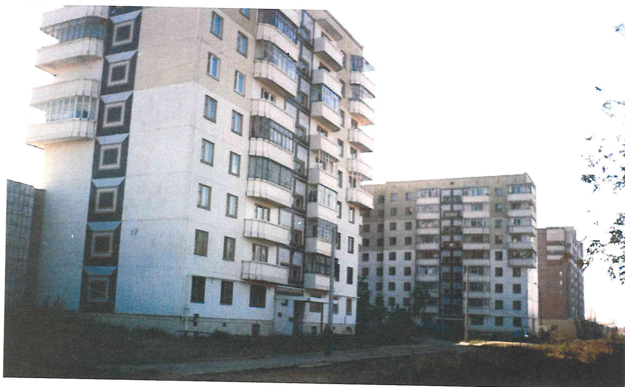
Жилой дом. Карпинского 103, микрорайон «Ераничи».

В микрорайоне «Ераничи» находился участок территории в виде треугольника ограниченного автотрассами и железной дорогой Пермь-Кунгур. В народе этот учас-