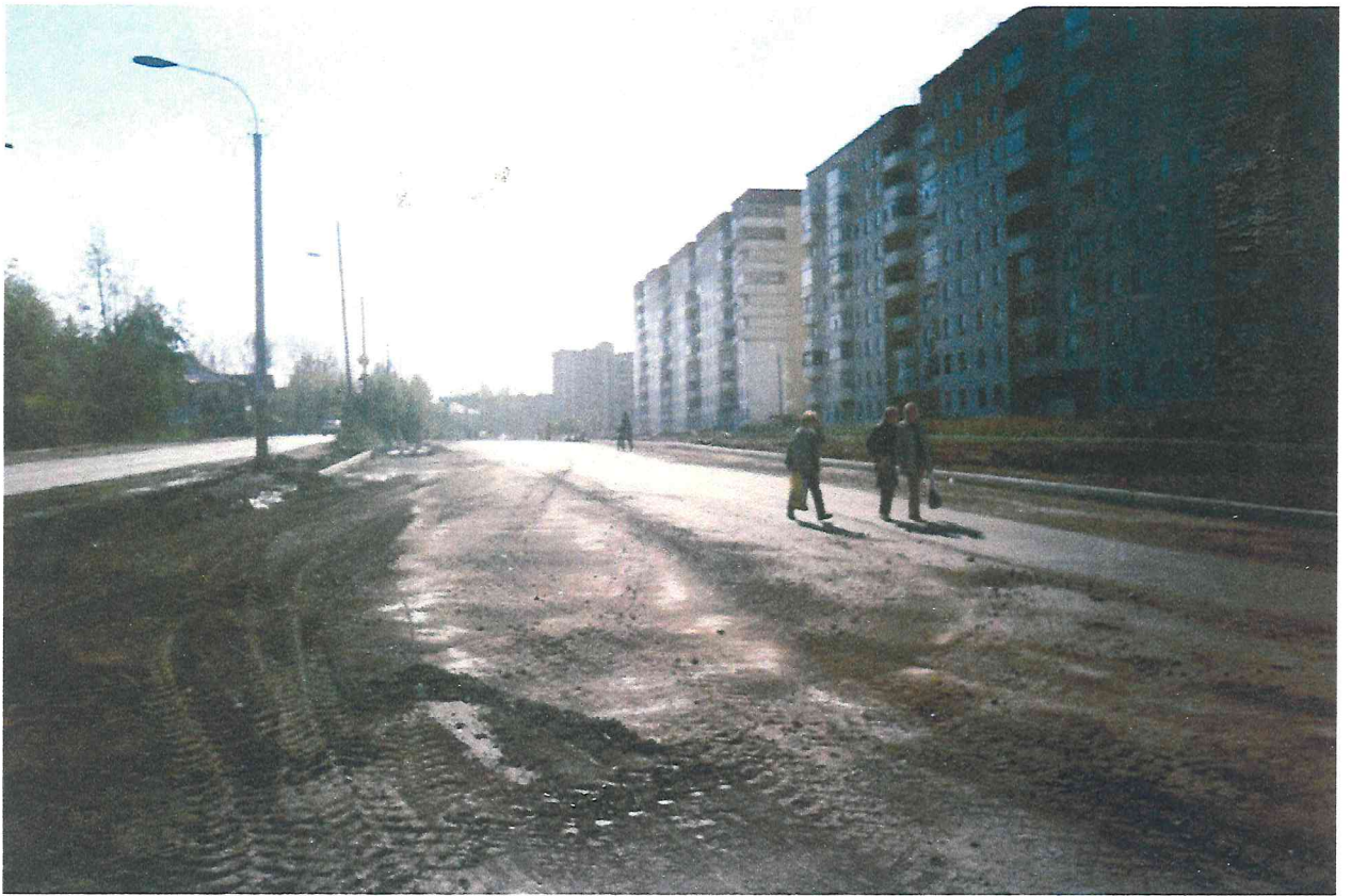
Вид прокладываемого трубопровода в Перми.

З а период 1970-1992 годы. УКС построил в городе Пермь сотни километров систем водоснабжения и водоотведения.