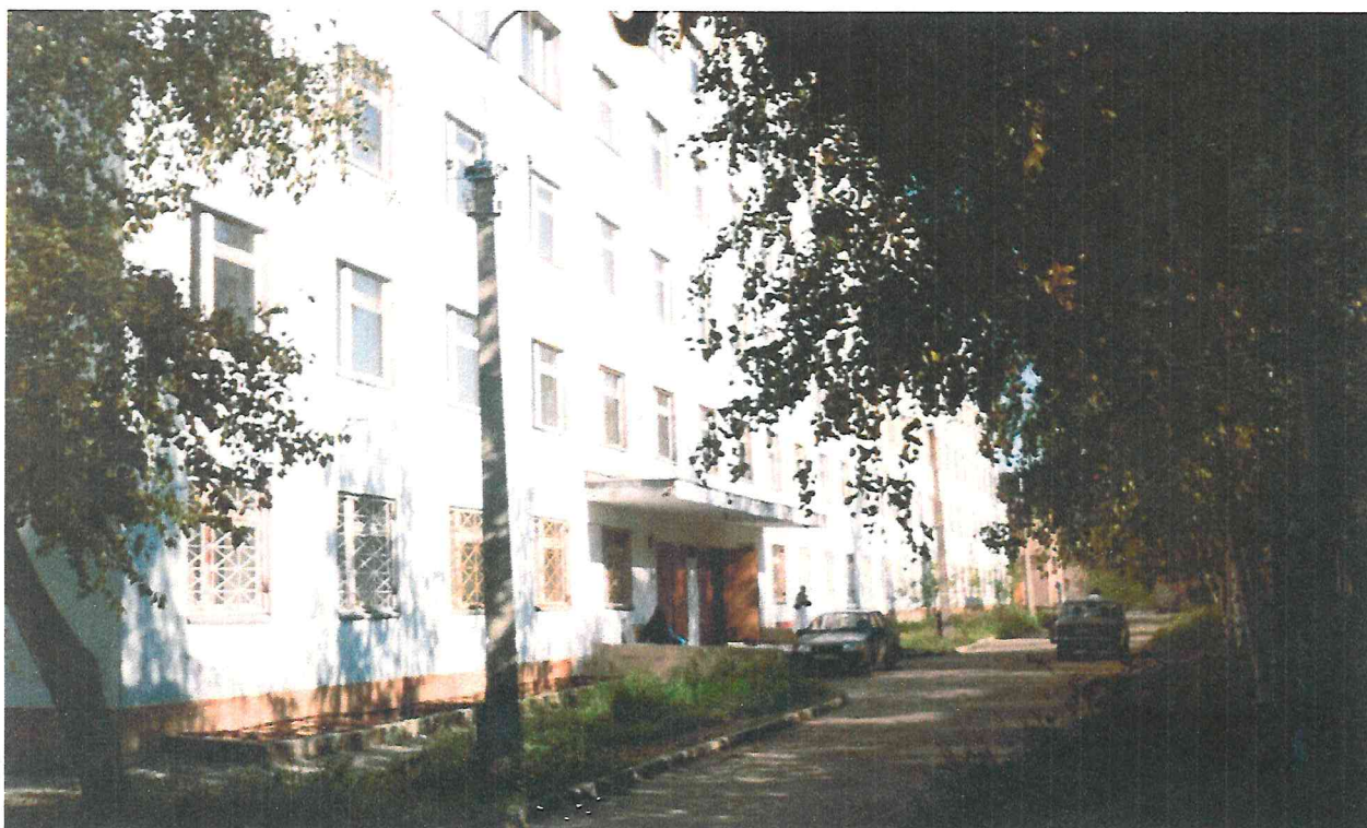
Здание родильного (акушерского) дома в МСЧ №9.