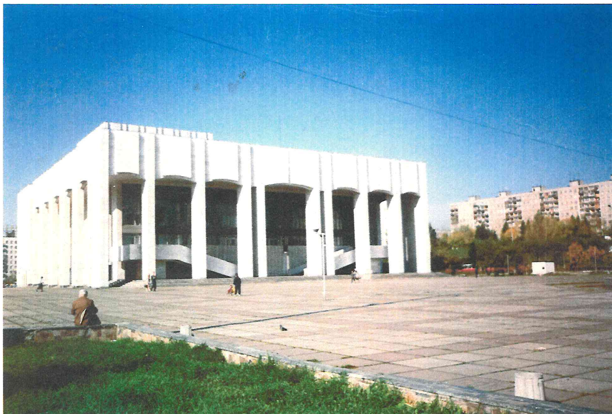
Вид здания Пермского академического театра драмы. В настоящее время «Театр-Театр».

И дея воздвигнуть современное здание нового театра в Перми возникла в середине шестидесятых годов прошлого века. Место для него было выбрано на улице Ленина между улиц Крисанова и Борчанинова.