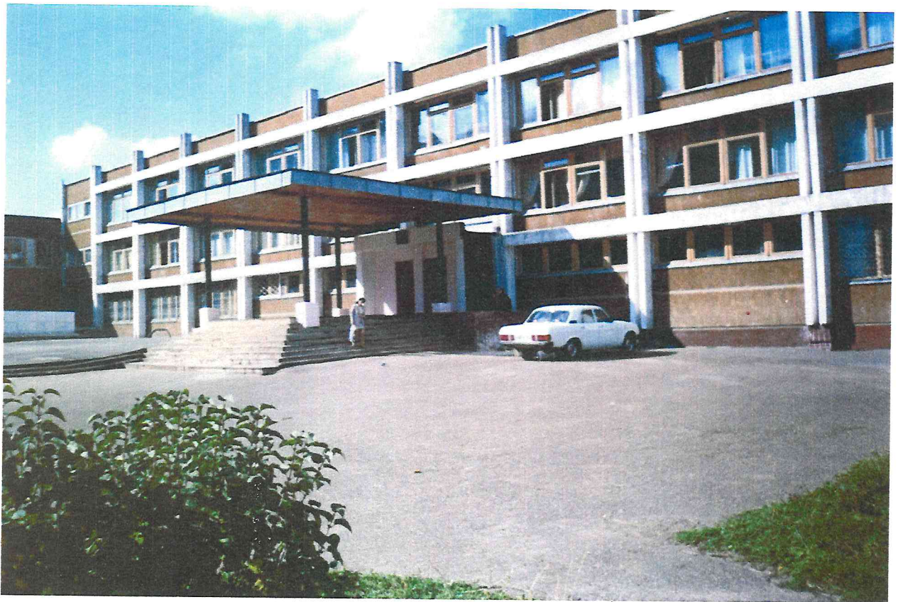
Здание школы №28, по ул. Луначарского, 4, в Ленинском районе города Перми