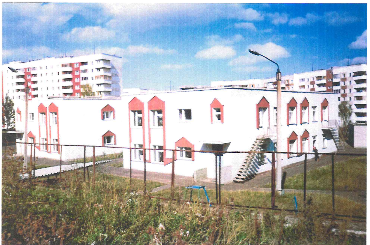
Здание детского сада №40, по ул. Юрша, 64а, в микрорайоне «Садовый».