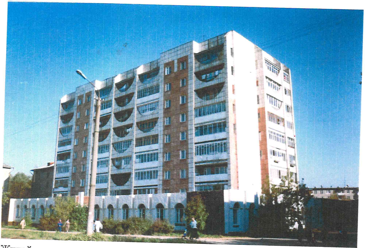
Жилой дом с музыкальной школой, ул. Советской армии, 23.