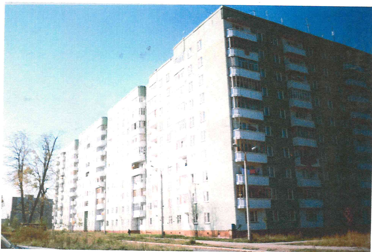
Жилой дом по улице Красноводская, 24, в микрорайоне «Акулова».