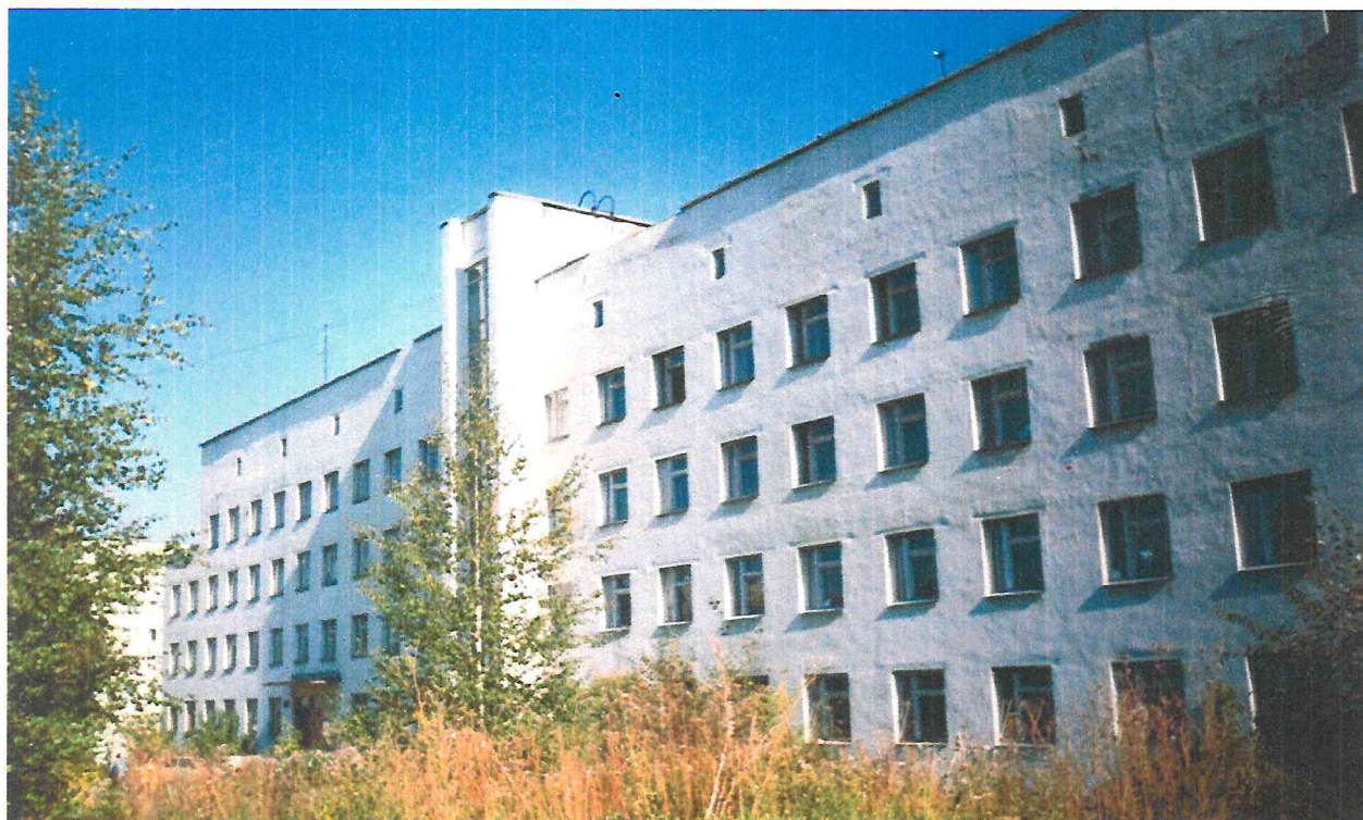
Здание гинекологического отделения МСЧ №9.

УКС заканчивал застройку микрорайонов Нагорный, Ераничи, Балатово и Верхние Муллы, а больницы с родильными отделениями не было.