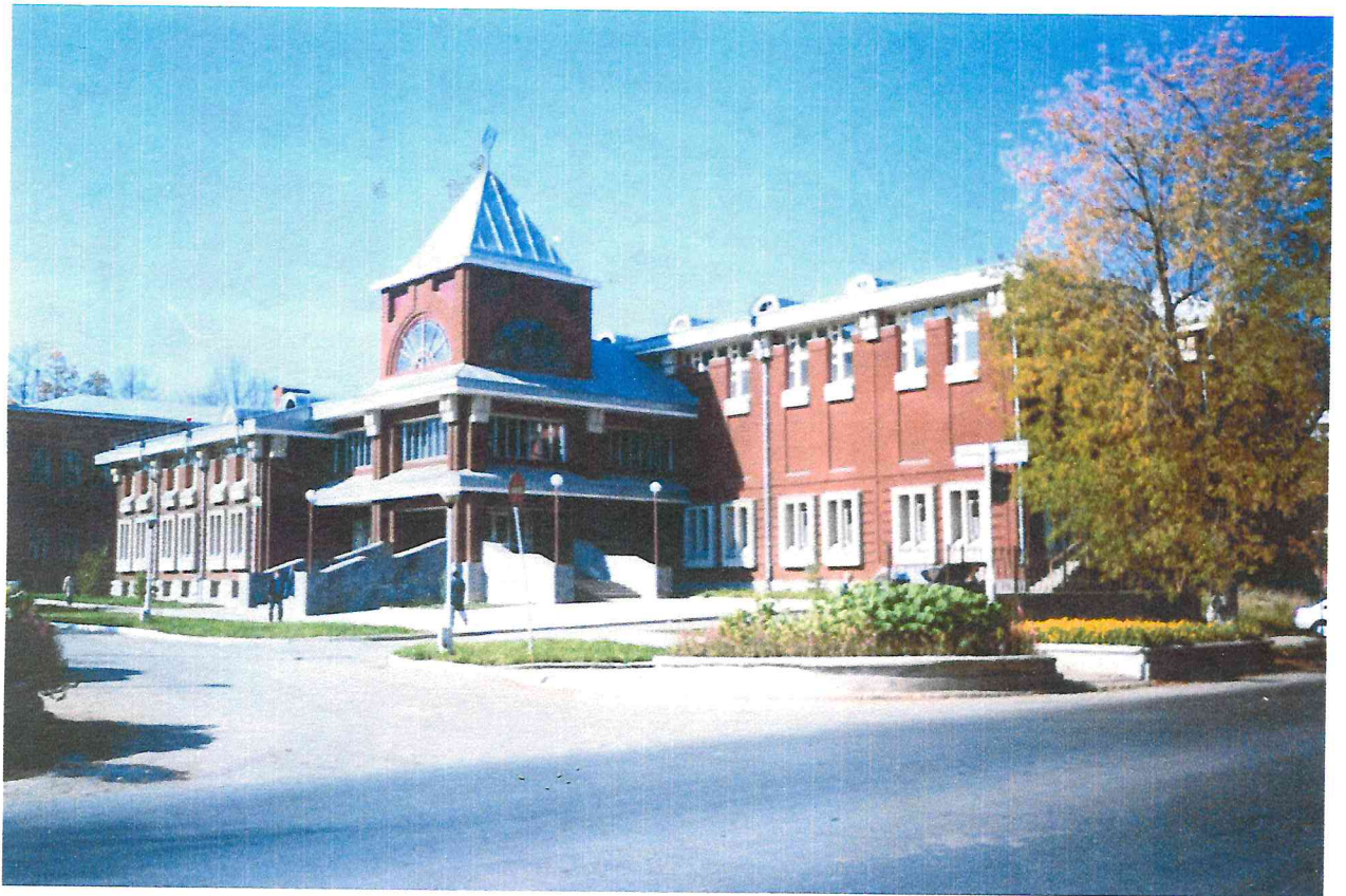
Пристрой к зданию школы №22, улица Сибирская.