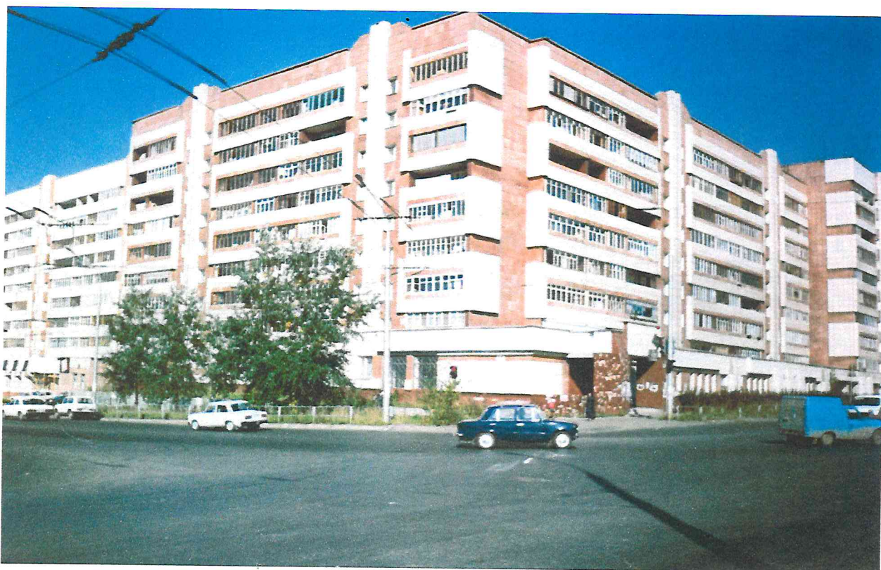
Жилой дом, Парковый, 35 с поликлиникой.

При застройке новых микрорайонов или «уплотнении» существующих УКС, для обеспечения обслуживания населения медицинским обслуживанием