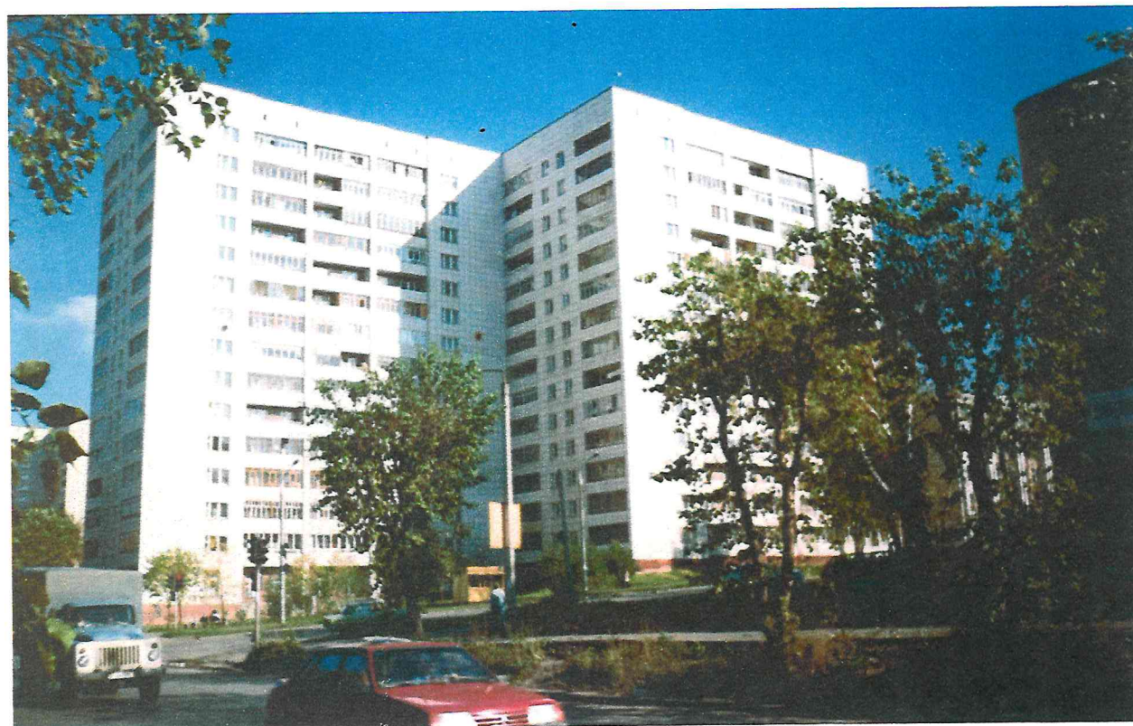
Жилой дом Крисанова, 26 с молочной кухней. Детское питание.

При освобождении строительной площадки «Дворца пионеров», УКС переселил СЭС, на вновь построенные помеще-