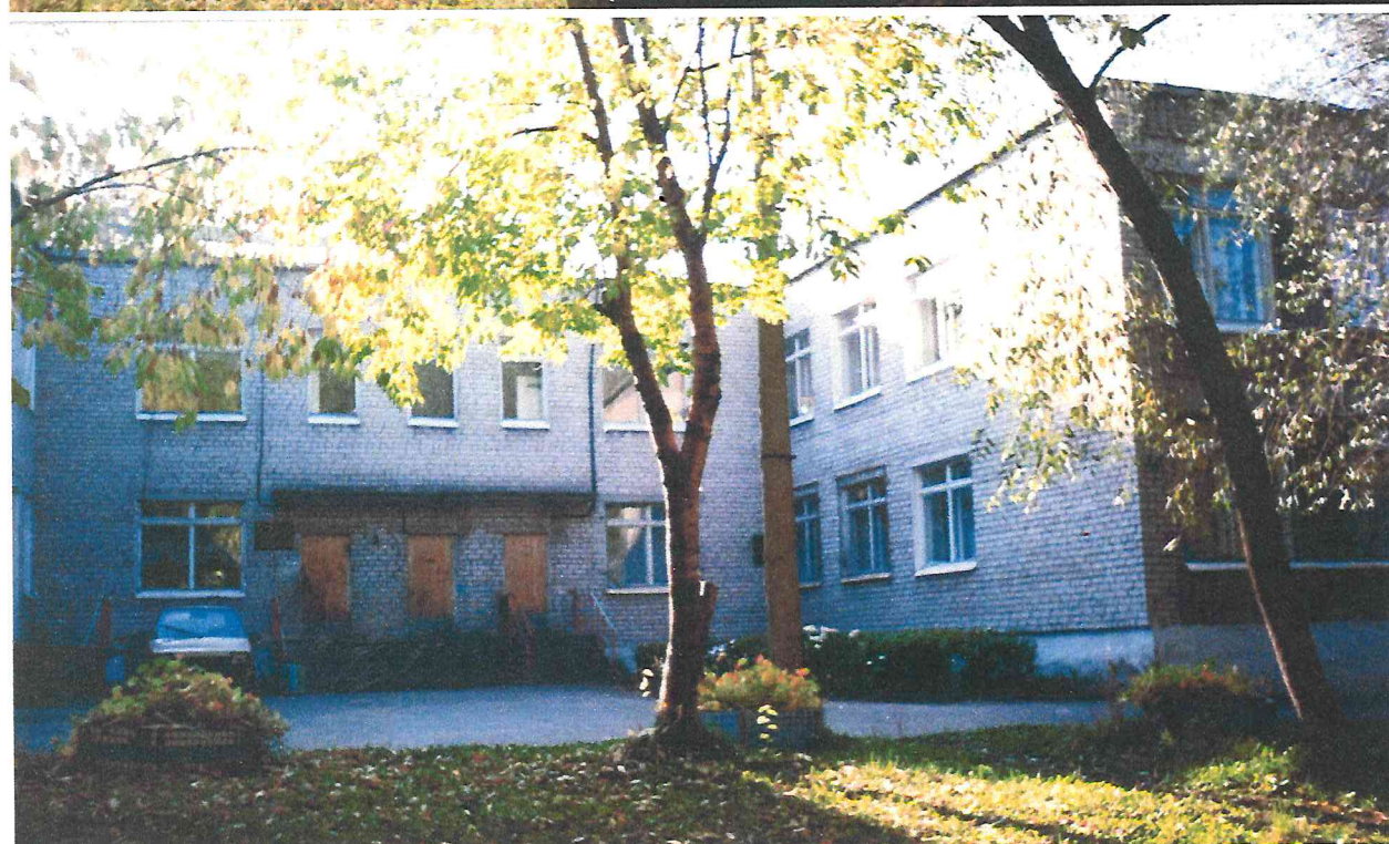
Санаторий «Светлана». Кировский район города Пермь.

Т ерритория санатория вплотную подходит к берегу Воткинского водохранилища, который систематически разрушается при паводковом периоде и сильном волнообразовании.