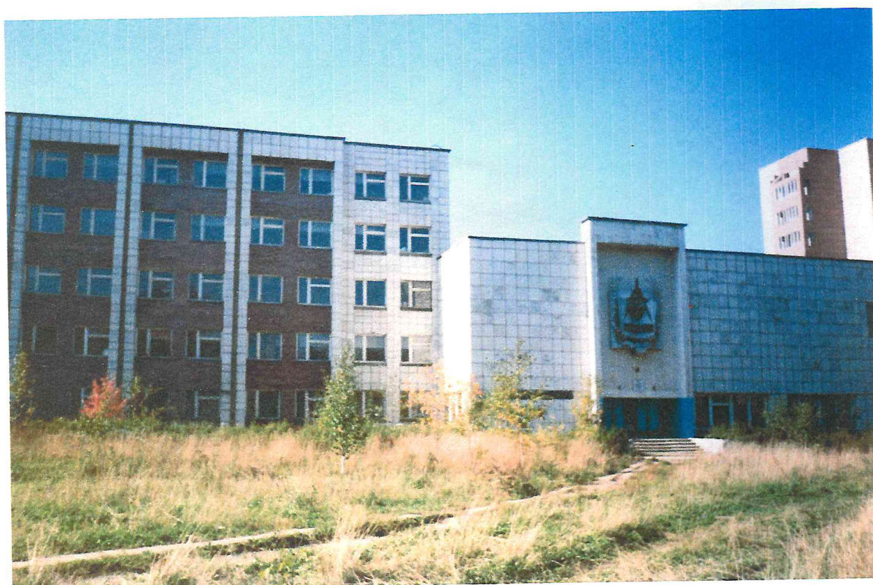
Здание ПТУ-52, по улице «Советской армии». В этом здании размещалось профессиональное училище работников Пермского треста «Пермремстрой»