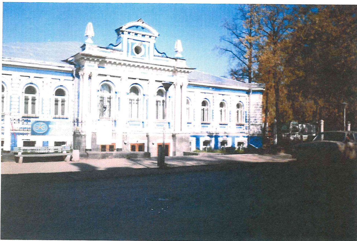
Вид фасада театра юного зрителя – ТЮЗ.

В шестидесятых годах прошлого века театр ТЮЗ и театр кукол располагались в переоборудованном здании пересыльной тюрьмы на улице Сибирской.