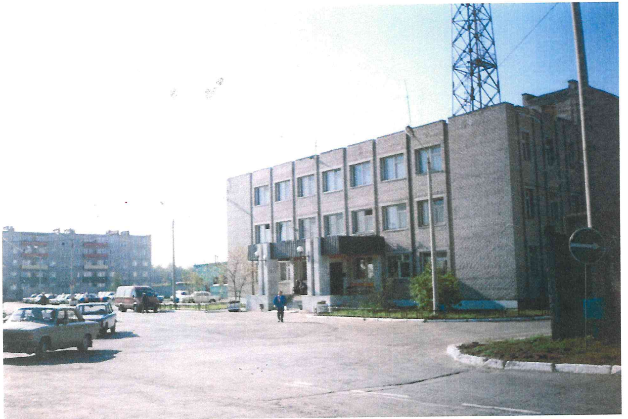
Здание полка патрульно-постовой службы. Микрорайон «Акулова»