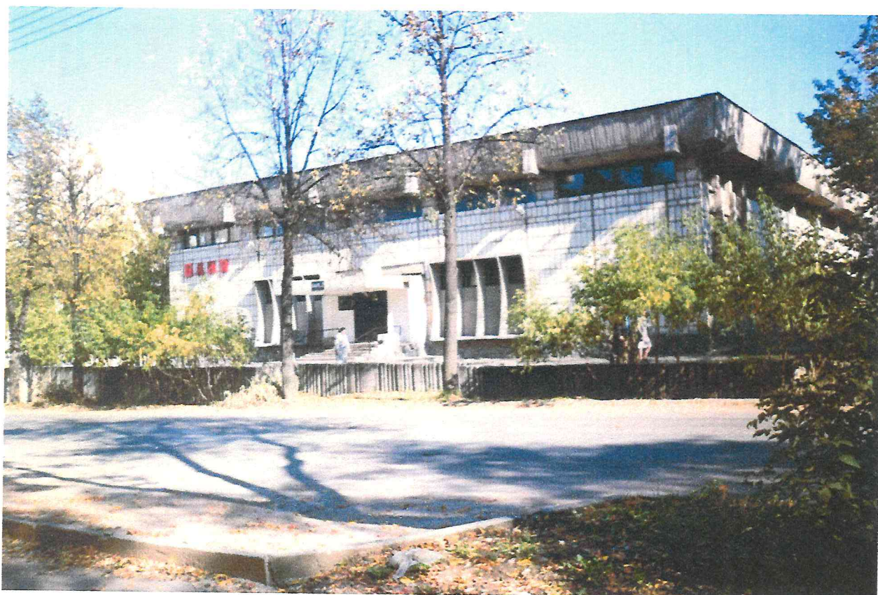
Городская баня, на улице Пушкина.