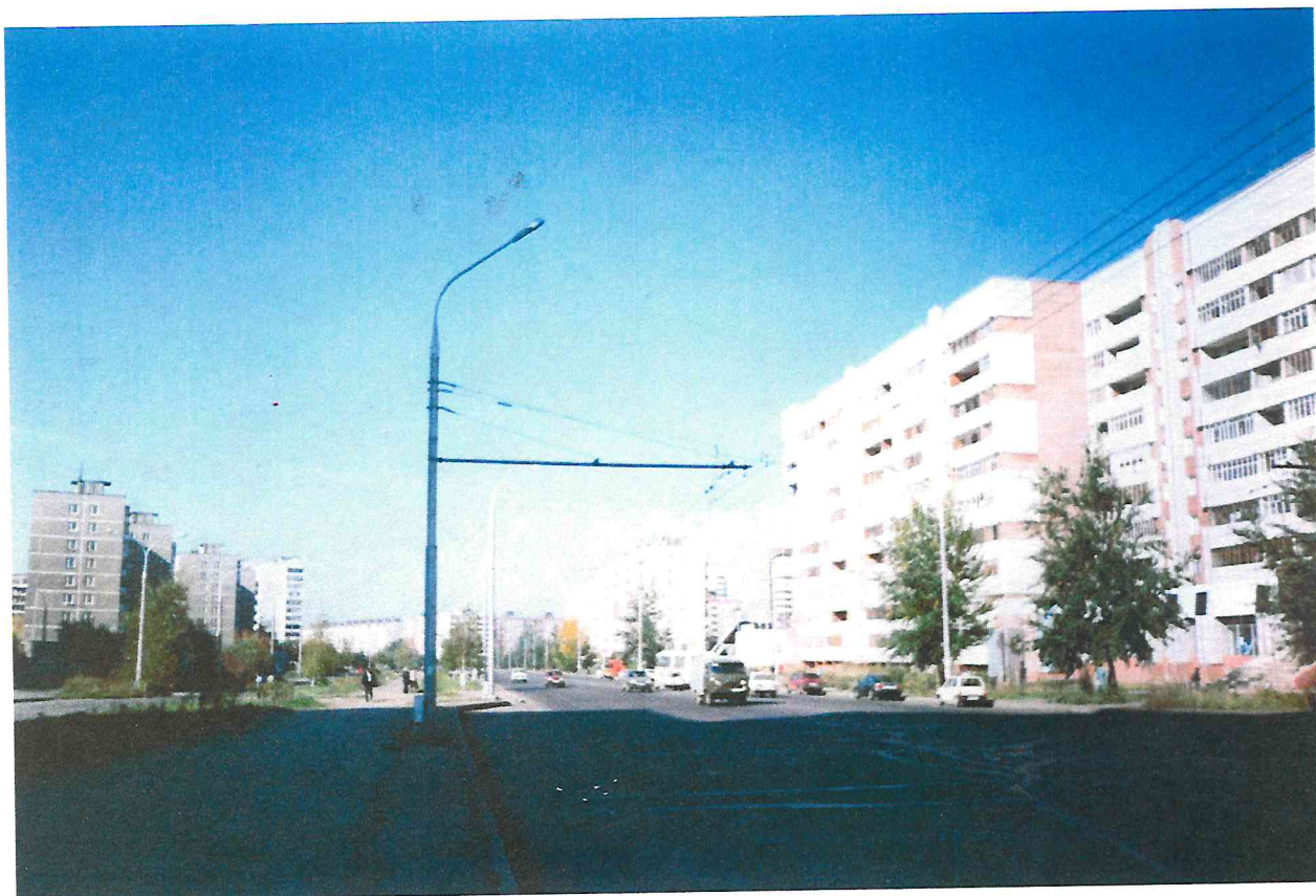
Проспект Парковый в микрорайоне «Парковый»