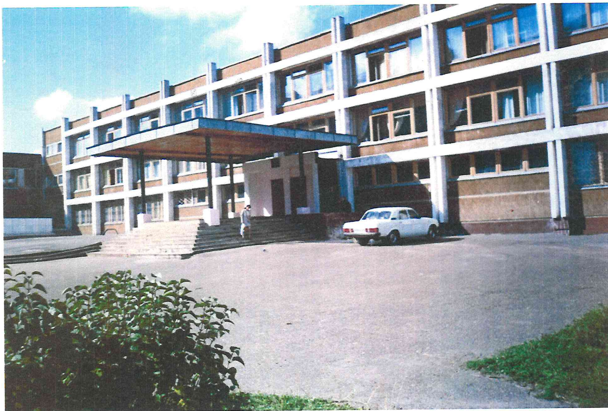
Здание школы №135, в микрорайоне «Садовый».