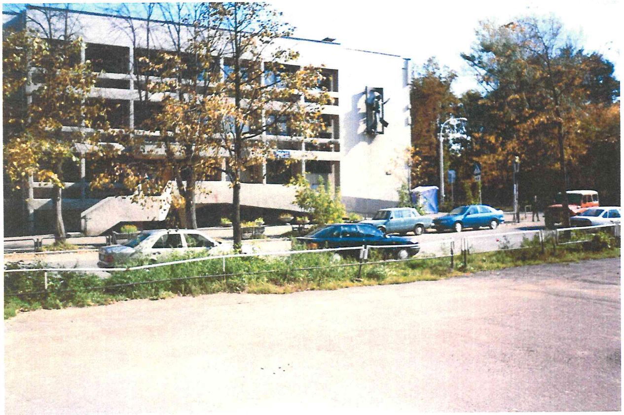
Вид «Дворца культуры Всероссийского общества слепых».

Д ворец культуры общества слепых был возведен по личному поручению руководителей Пермского облисполкома на месте двух частных домов.