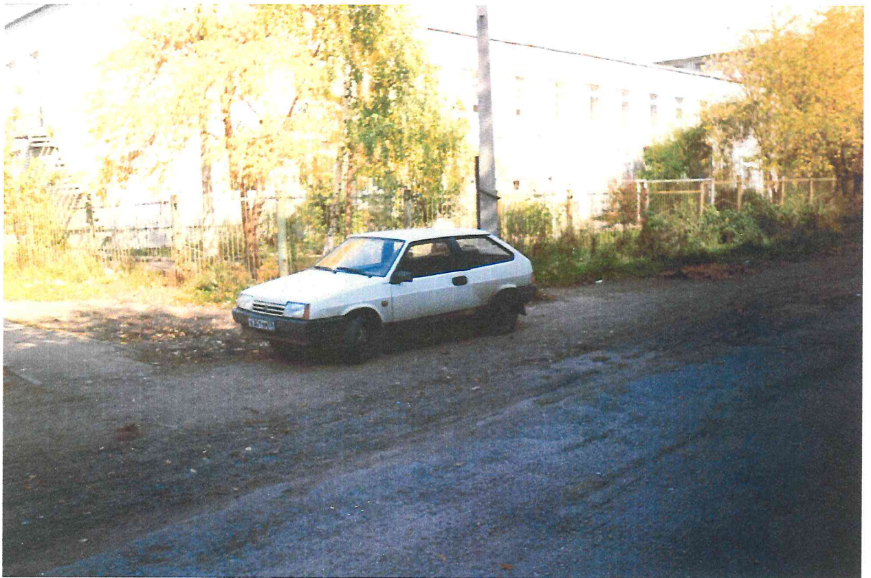
Здание детского дома №369, по ул. Балхашская 203, в микрорайоне «Юбилейный».