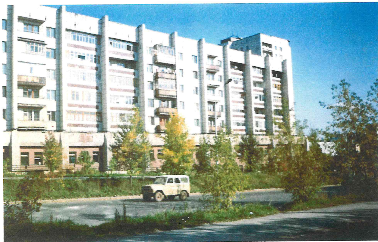
Жилой дом Крисанова, 10 с СЭС Ленинского района и отделением ортопедией.