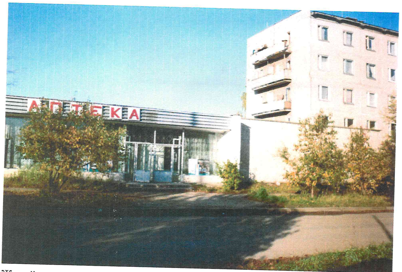
Жилой дом с аптекой по ул. Щербакова, 49.