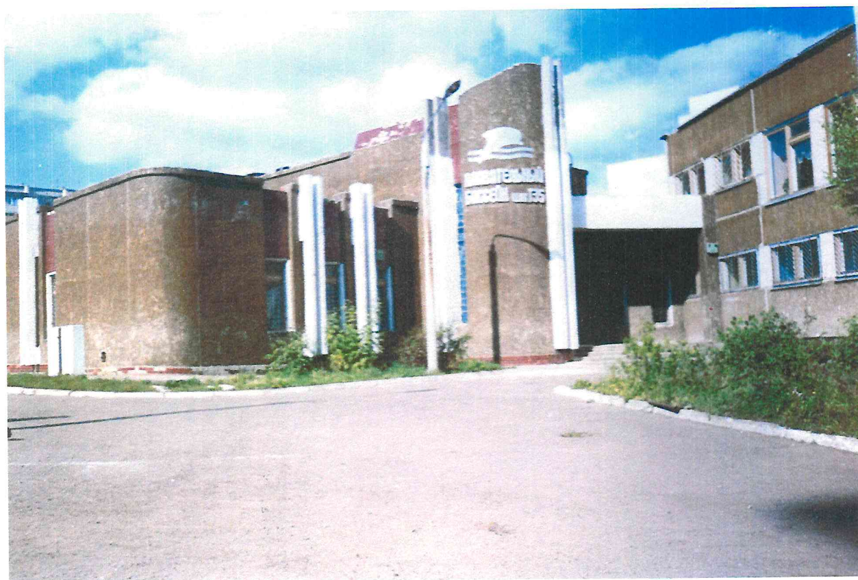
Вид на плавательный бассейн школы № 135. Микрорайон «Садовый» первый квартал застройки территории.