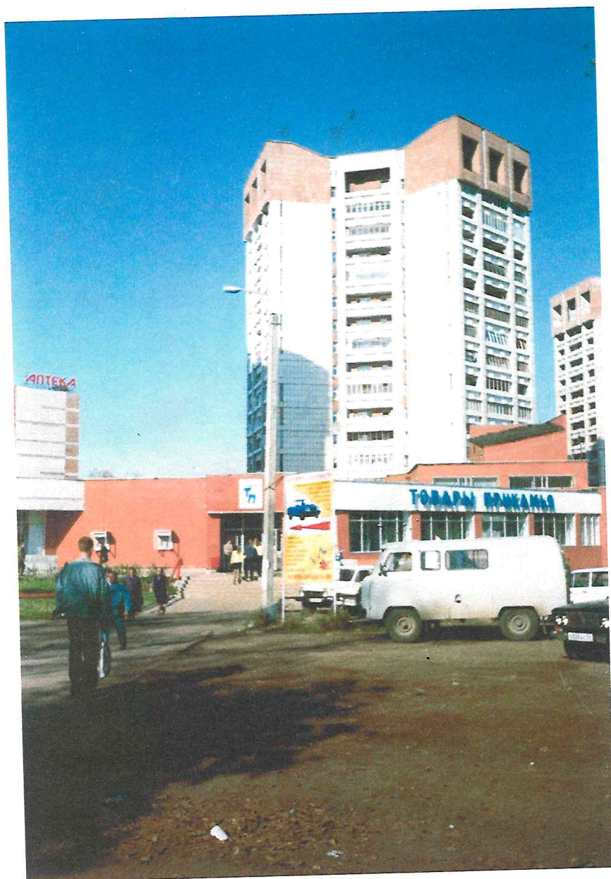
Жилые дома 25 и 27, по улице Попова с магазином «Товары Прикамья».

Четыре высотных жилых дома по улице Попова были первыми домами города, возведенными в 16 этажей. Эти дома были долгие годы визитной карточкой архитекторов области.