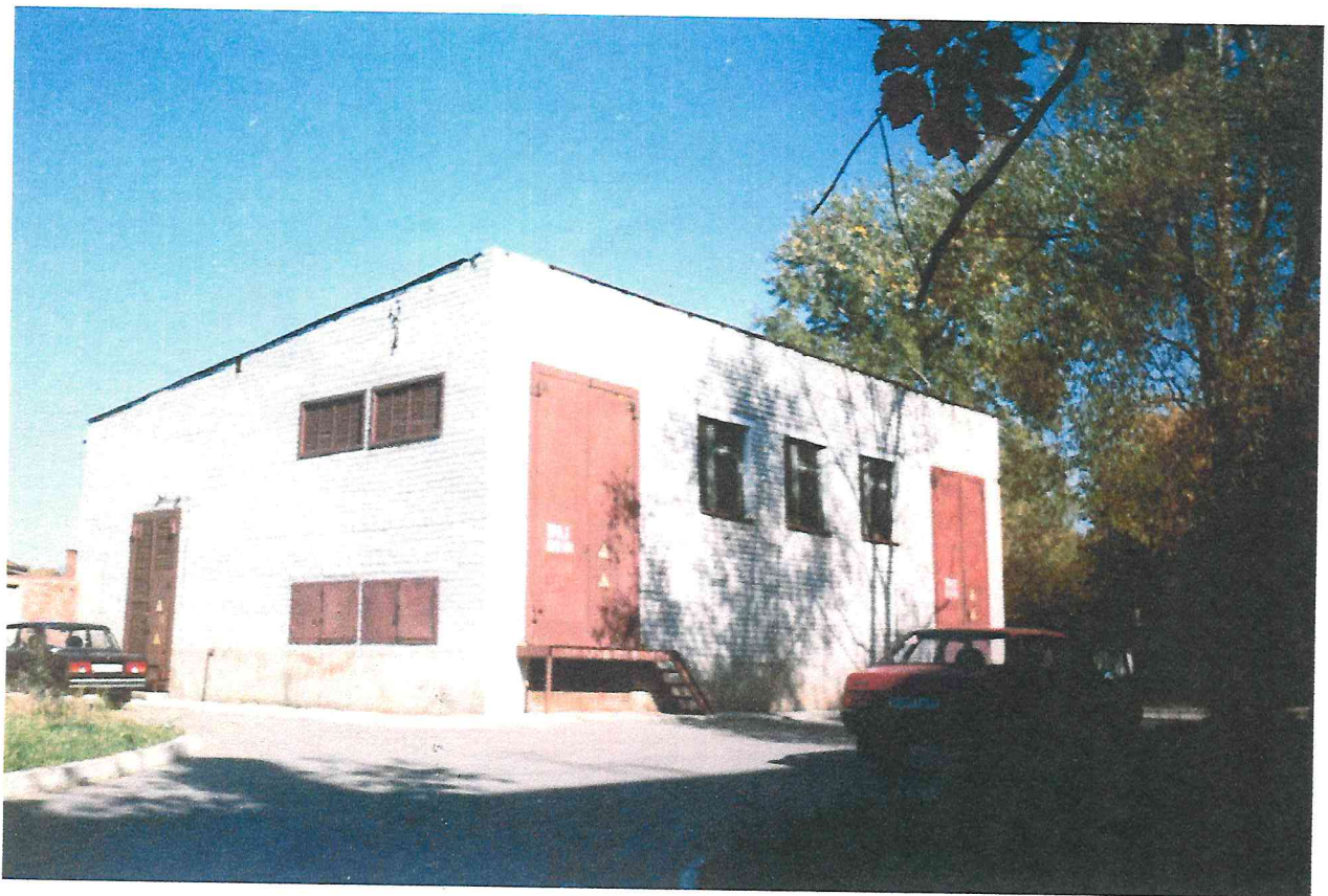
Здание тяговой подстанции №32 в микрорайоне «Громовский».