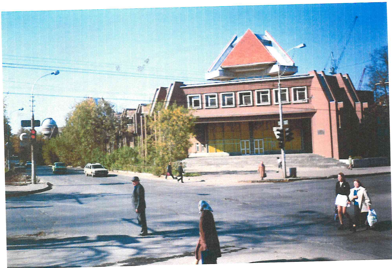
Дворец пионеров. Сегодня это «Дворец детского творчества города Перми».

В середине восьмидесятых годов прошлого века, в нашей стране началось массовое строительство дворцов пионеров.