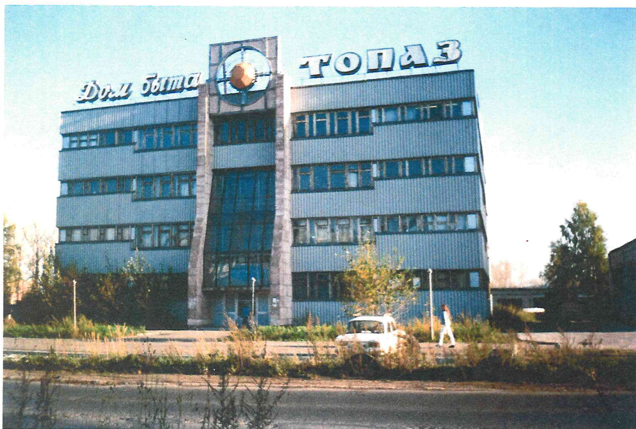
Здание дома быта «ТОПАЗ» в Орджоникидзевском районе города. Построено по типовому проекту.