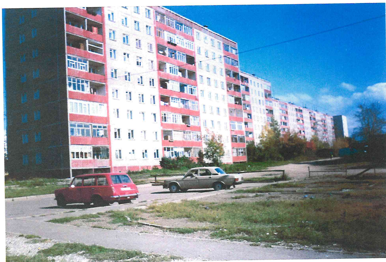
Жилые дома по улице Тбилисской в микрорайоне «Крохалева»