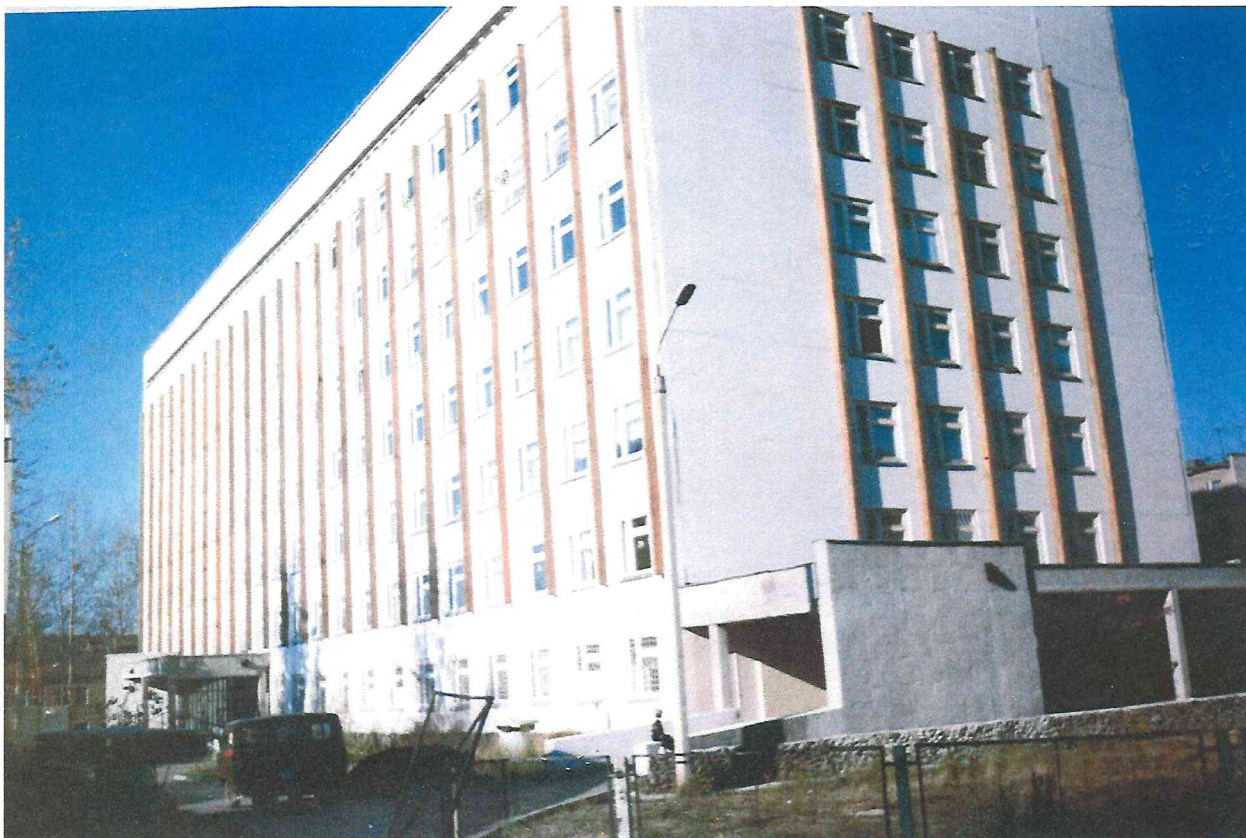
Хирургический корпус МСЧ -11 (Кировский район).

УКСу приходилось не только проектировать и строить объекты здравоохранения, но и достраивать здания начатые предприятиями города.