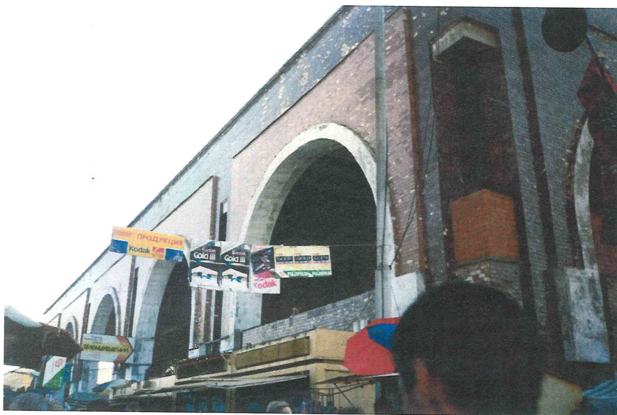
Здание торгового павильона на Центральном рынке города.