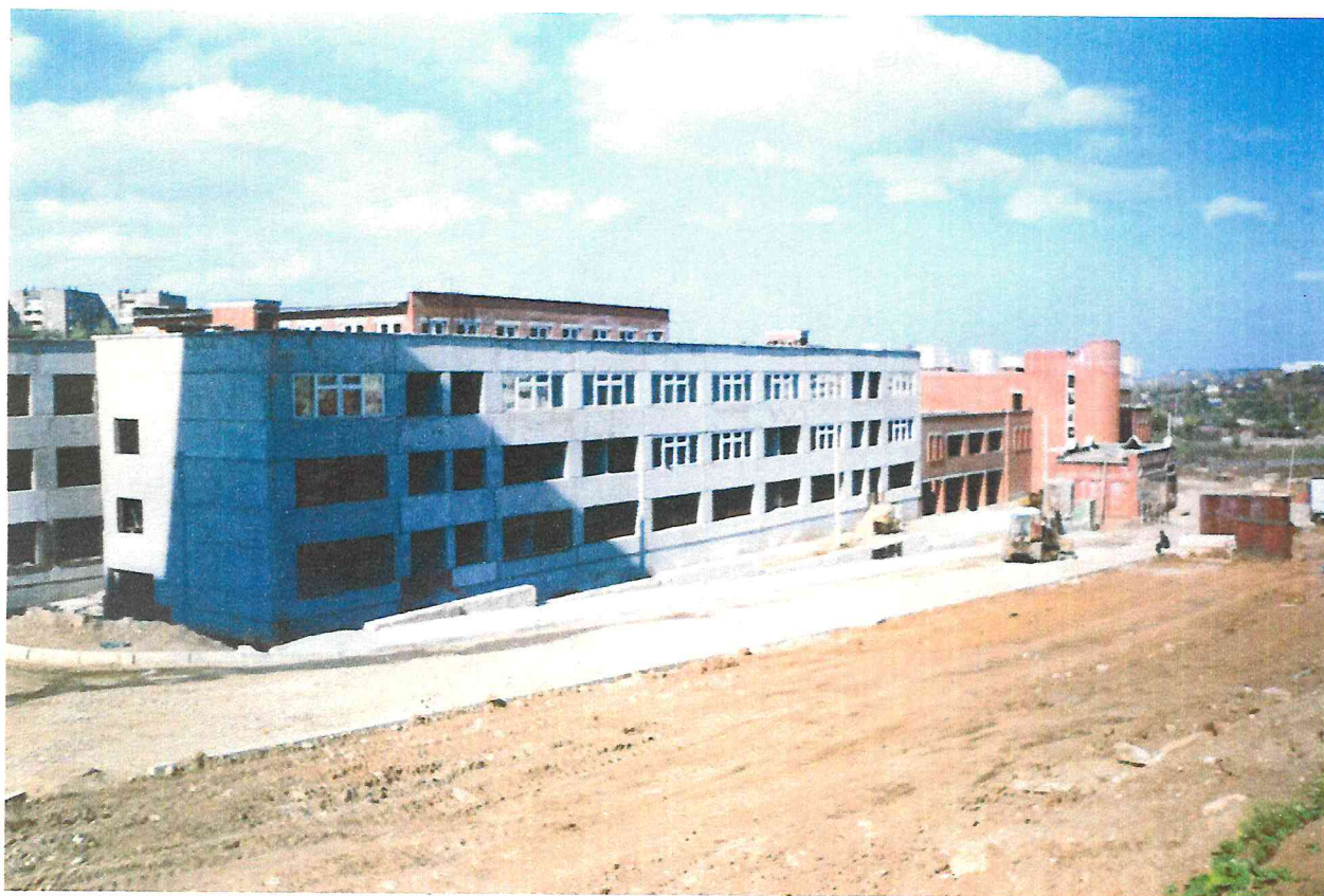
1992 год. Вид на строящееся здание школы №151, микрорайон «Садовый» третий квартал строительства, здание школы строилось более 10 лет.