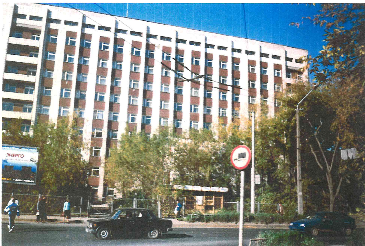
Ортопедический корпус Пермской краевой клинической больницы.