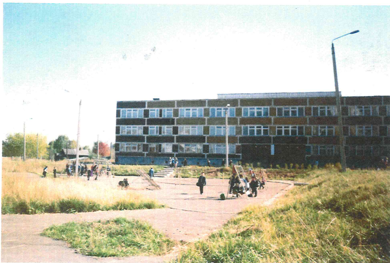
Здание школы № 140, по ул. Льва Толстого, 12. Новоплоский.