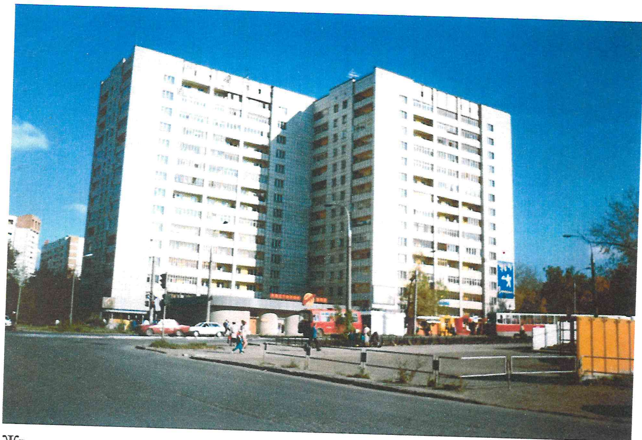
Жилые дома по улице Борчанинова 12, 14, со встроенным в первый этаж и пристроенным помещением кафе.

Осваивая застройку центральной части города УКС, стремился создать возможность жителям домов иметь в шаговой доступности предприятия торговли и отдыха.