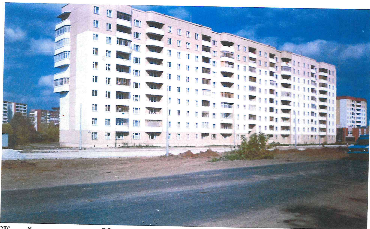
Жилой дом по улице Юрша 25, микрорайон «Садовый».