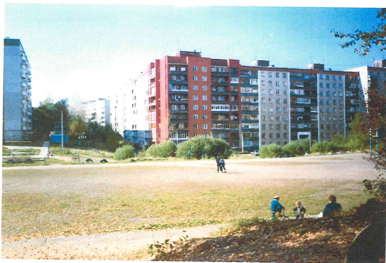
Жилые дома в микрорайоне «Юбилейный».