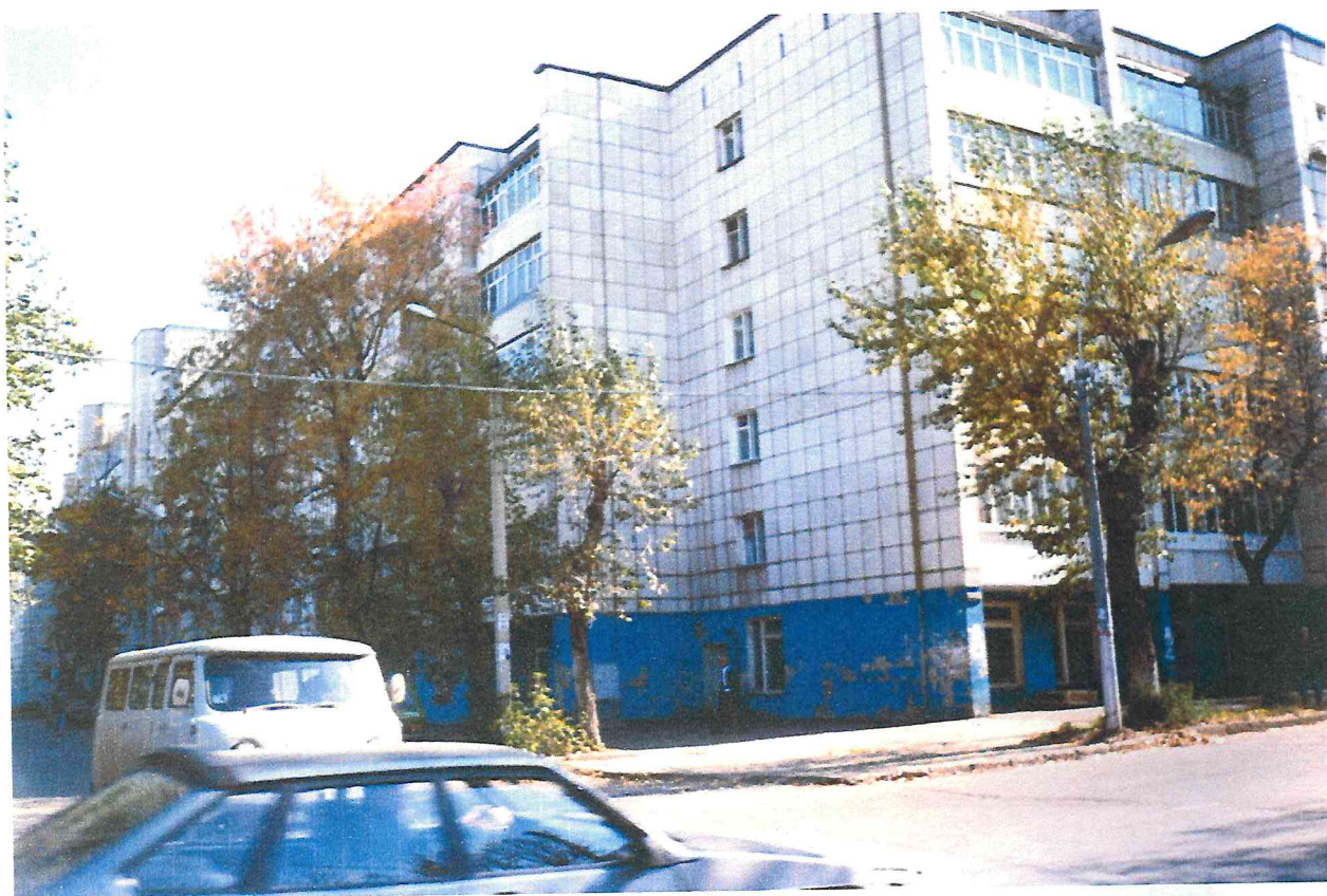
Жилой дом, по ул. 25 Октября, 22, «Дом актера». Построен, для проживания актеров Пермских театров.