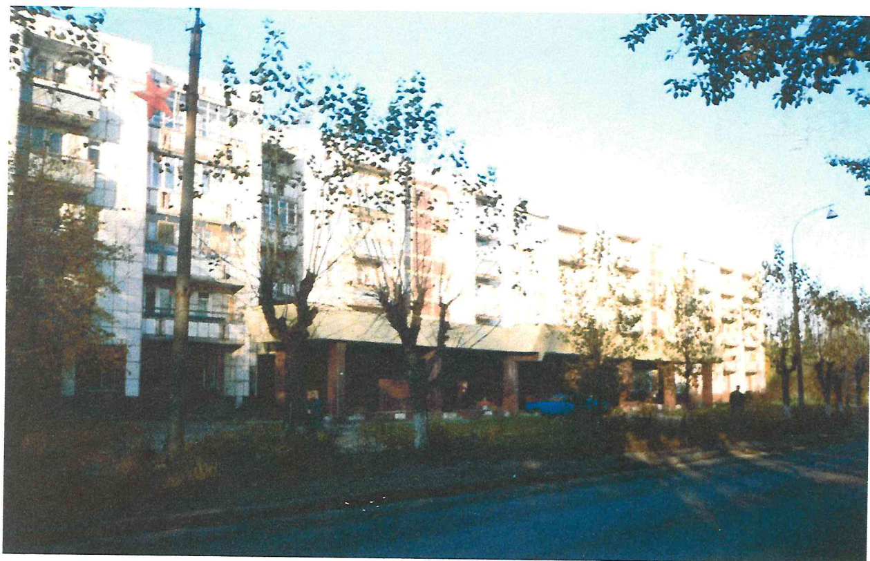
Жилой дом по ул. Веденева, 80, с поликлиникой.