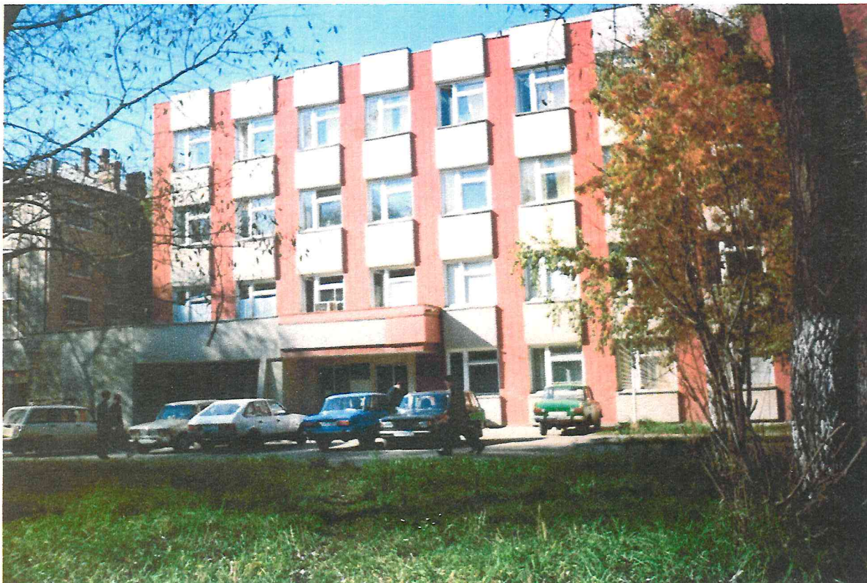
Городская стоматологическая поликлиника №2 на улице Студенческая

Многие промышленные предприятия города оказывали здравоохранению материальную помощь в создании современной (по тем временам) технологиям. В 1980 году в УКС обратился главный врач стоматологической поликлиники №2 Э.Марголин, расположенной в Мотовилихе с ходатайством о строительстве нового здания поликлиники.