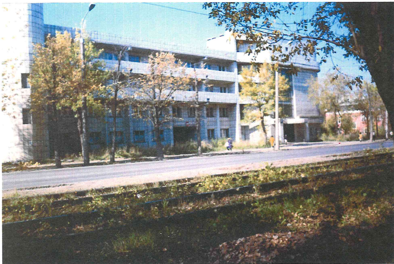
Корпус больницы №7 по улице Героев Хасана.

В семидесятых, восьмидесятых годах прошлого века значительное внимание руководство города было направлено на создание материальной базы здравоохранения города.