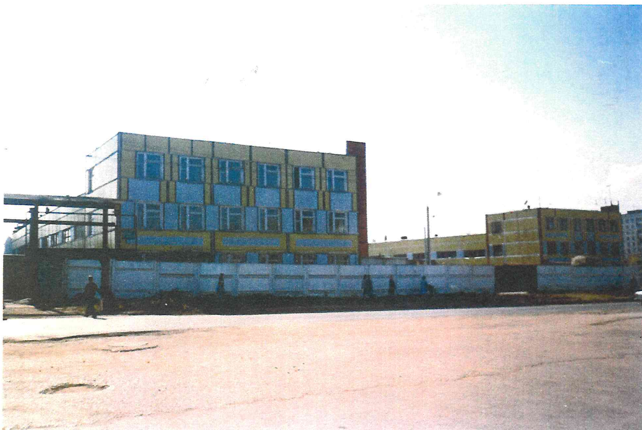
Мастерские организации «Лифтмонтаж» на ул. Ладыгина.