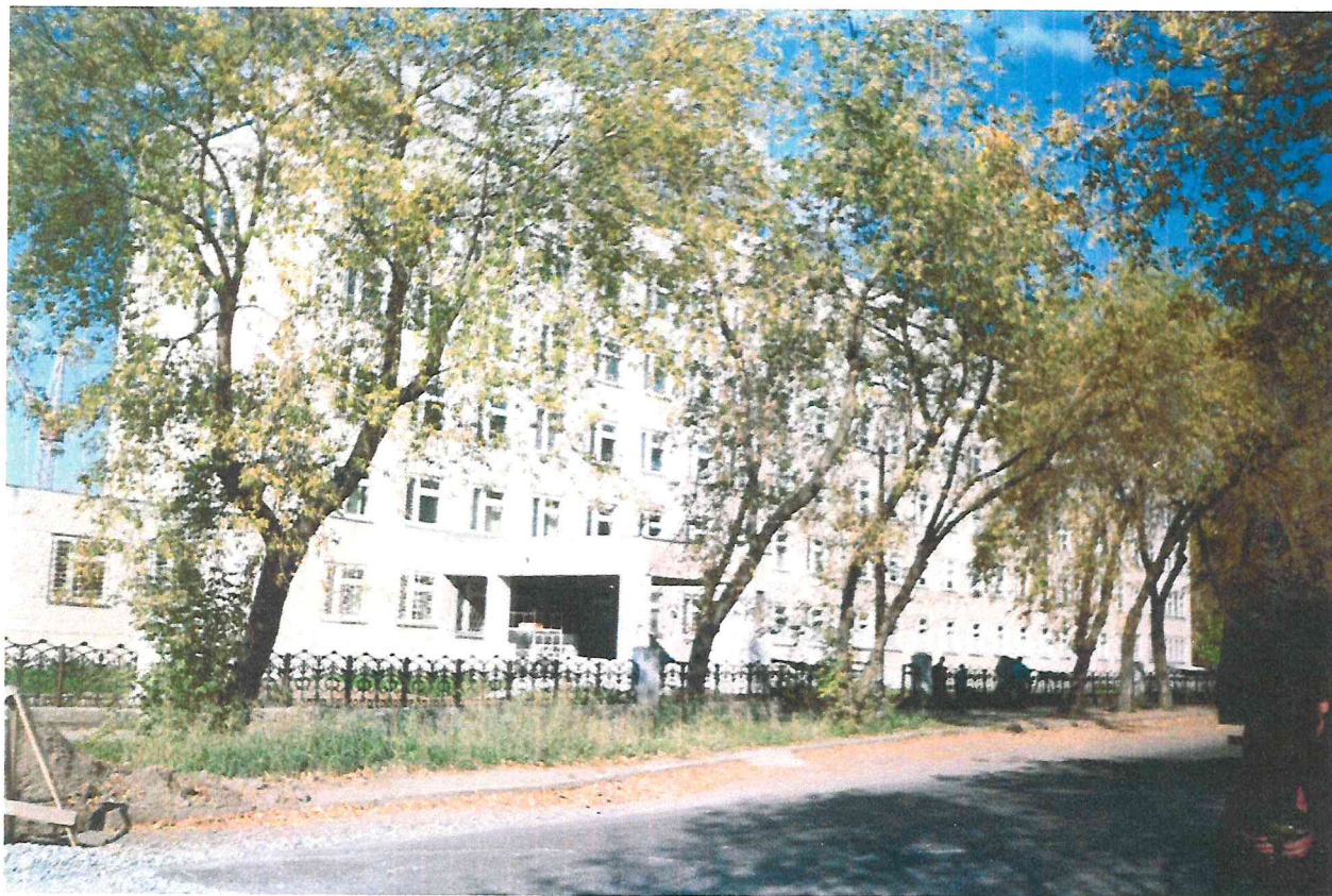
Корпус детской больницы №13 в Мотовилихе по ул. Лебедева, 44.

К орпус детской больницы №13 в Мотовилихе «выплыл» для УКСа совершенно «случайно».