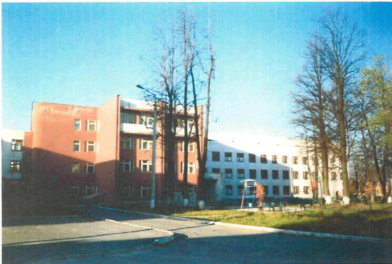
Главное здание детской поликлиники №20 (Кислотные дачи).

В 1983 году руководство города приняло решение о развитии территории в восточном направлении, начать массовое строительство жилья на свободных территориях в районах Левшино, Голованово и Кислотные дачи. Автоматически потребовалось увеличение и базы лечебных учреждений, в первую очередь детских больниц.