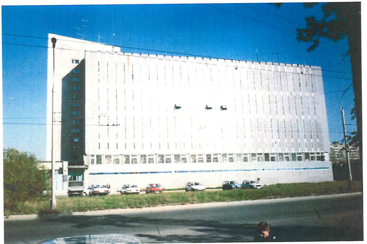
Здание АТ –35, в микрорайоне «Парковый».