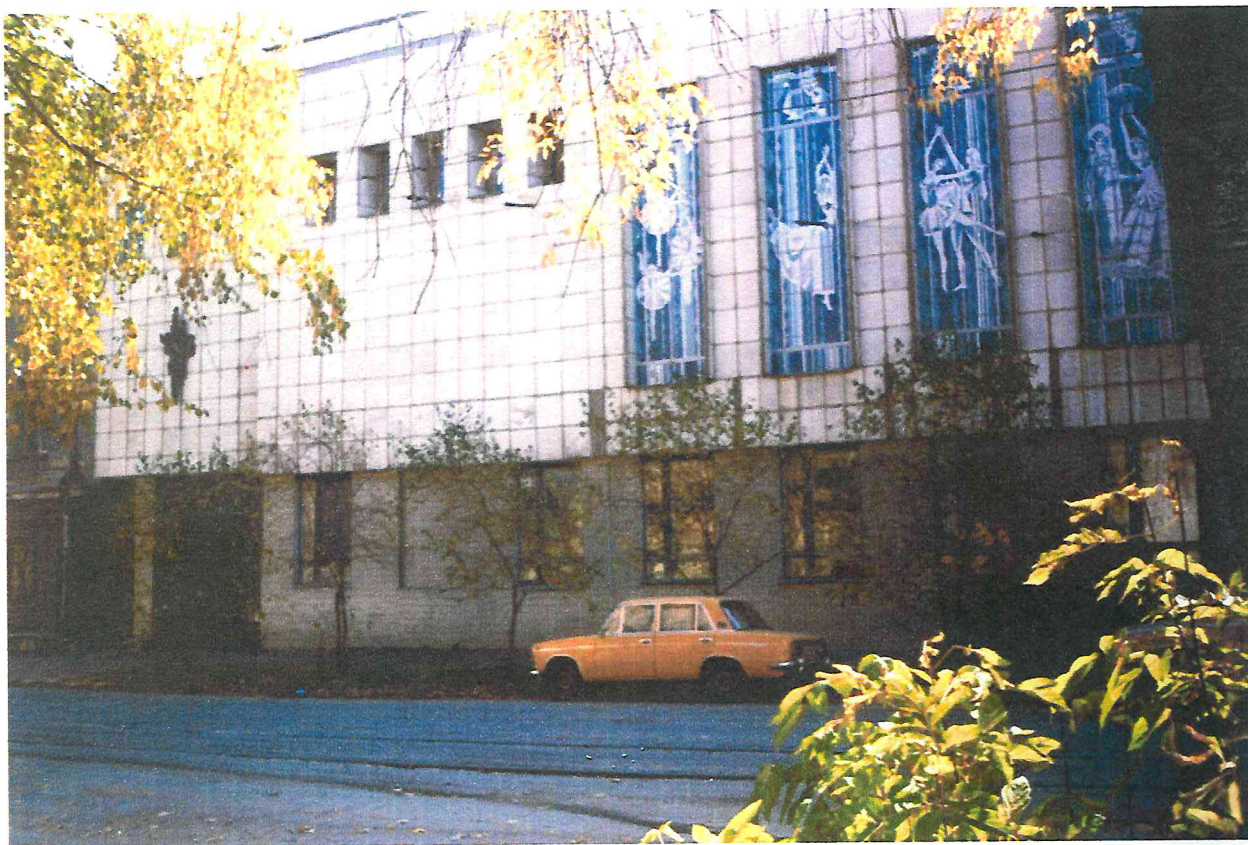
Пристрой Пермского хореографического училища.

Пермское хореографическое училище в Перми, память пребывания в нашем городе, в годы ВОВ, коллектива Ленинградского оперного театра.