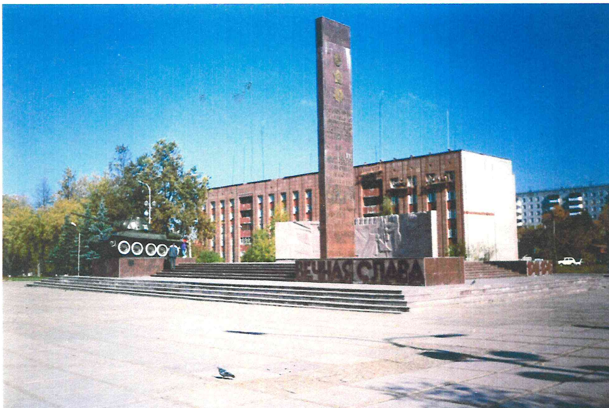
Памятник «Уральскому Добровольческому танковому корпусу» на фоне здания управления внутренних дел города.

При возведении памятника «Уральскому Добровольческому танковому корпусу» времени для художественного оформления конструкций практически не было – сроки открытия «поджимали» и поэтому стелу выполнили из двух рядом установленных бетонных столбов, оштукатуренных и покрытых обычной белой краской. Танк установили на пьедестал, который выполнили из фундаментных бетонных блоков, оштукатуренный и окрашенный то же в белый цвет.